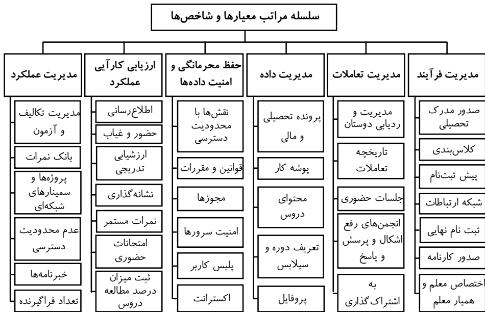
شکل ۲. سلسله‌مراتب معیارها و شاخص‌های ابزارهای آموزشی با رویکرد شبکه‌های اجتماعی

تعاملات موجود در شبکه مدارس و مدیریت فرآیندهای موجود در شبکه دانش و شبکه اجتماعی و شبکه مدارس دانش‌آموزان، مربیان و مدیران مدارس می‌باشد. ۲. طراحی ساختار سلسله‌مراتبی: در این مرحله از پژوهش، سلسله‌مراتبی از هدف، معیارها و زیرمعیارها طراحی شد. لازم به ذکر است به منظور ساده‌سازی انجام مراحل تحقیق، ساختار سلسله‌مراتب مورد نظر تا زیرمعیارها (شاخص‌ها) گسترش داده شد و از بیان گزینه‌ها صرف نظر می‌گردد. شکل ۲، ساختار سلسله‌مراتب مؤلفه‌های طراحی ابزارهای آموزشی در مدارس با رویکرد شبکه اجتماعی را نمایش می‌دهد.