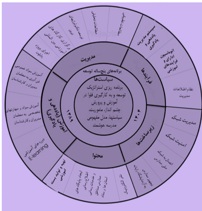
شکل ۱. ابعاد طرح هوشمندسازی مدارس در آموزش و پرورش

در مدارس هوشمند، کامپیوتر، جایگزین تخته سیاه، و لوح فشرده (CD) جای دفتر مشق را می‌گیرد. دانش‌آموزان می‌توانند از طریق اینترنت اطلاعات بسیاری را درباره هر موضوع که بخواهند، به دست آورند. در این سیستم، معلم و شاگرد هر دو تولید محتوای الکترونیکی و درس را به صورت لوح فشرده ارائه می‌کنند. در این مدارس، آموزش منحصر به معلم نیست و دانش‌آموز نقش اساسی در آموختن مباحث علمی دارد. دبیران با استفاده از محتوای درسی الکترونیکی موجب تفهیم بهتر مطالب درس و صرفه‌جویی در وقت می‌شوند و دانش‌آموزان هم این فرصت را دارند که توانایی و قابلیت‌های خود را آشکار و به تولید محتوا بپردازند. (Abadi, 2015)